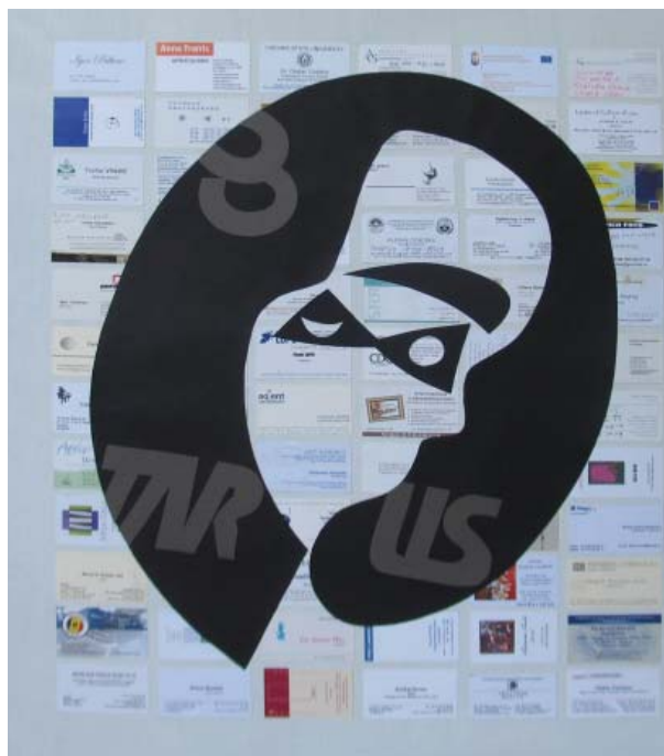
Mihai Țăruș, Autoportret , colaj pe pânză, 800×700 mm, 2009