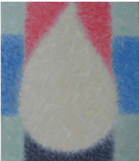
Mihai Țăruș, Geometrie ambientală, formulă , u/p, 360×300 mm, 2009

Astfel, chiar din copilărie este antrenat să răspundă provocărilor într-o primă experiență complexă – trecerea de la modul de viață rural către cel urban, care ineluctabil reclamă, în particular, considerarea și respectarea setului de exigențe imanente civilizației contemporane.