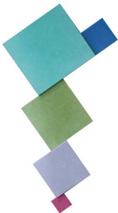
Mihai Țăruș, Coforma-3 , u/p, 5 piese, 2100×1080×40 mm, 2010